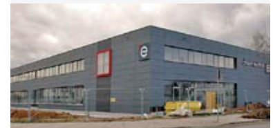
Baufortschritt Firmenneubau Februar 2009

Enno-Heidebroek-Straße 12 01237 Dresden-Reick