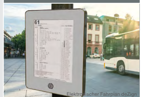
Elektronischer Fahrplan deZign