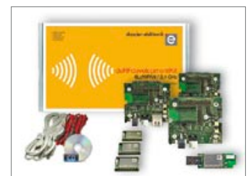
deRFdevelopmentKit – Entwicklungsumgebung zur Erstellung von 6LoWPAN-Anwendungen