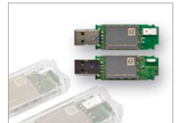
deRFusb – Funk-Sticks mit Cortex-M3 Mikrocontroller für 2,4 und Sub-GHz