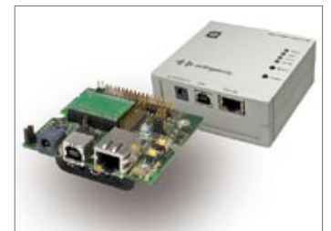
deRFgateway – Development Board mit USB- und Ethernet-Anschluss