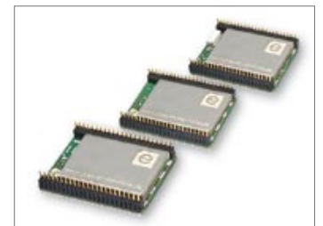
deRFarm7 – Funk-Module mit ARM7 Mikrocontroller für 2,4 und Sub-GHz

Aktuell wird bei dresden elektronik ein Inhouse-Schulungskonzept vorbereitet, das Ihnen den Einstieg in die drahtlose Netzwerkkommunikation erleichtern soll. Weitere Informationen folgen ab Mai 2011. Bei Interesse kontaktieren Sie uns bitte unter: wireless@dresden-elektronik.de